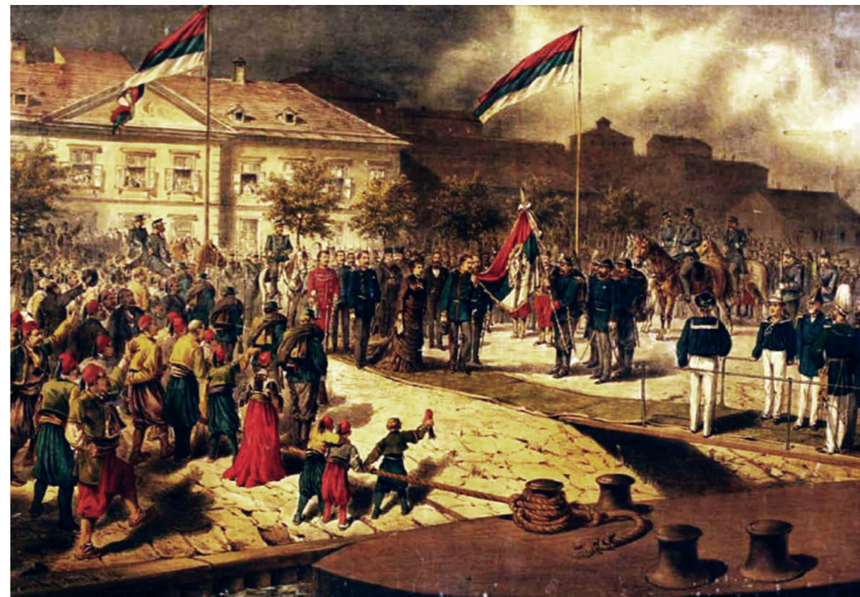
| Кнез Милан 29. јуна 1876. са београдског пристаништа креће на фронт

Српска војска је у почетку напредовала на свим правцима. Међутим, Турци су брзо успели да зауставе офанзиву, пређу у контранапад за неколико дана поврате своје положаје и заузму Велики извор.