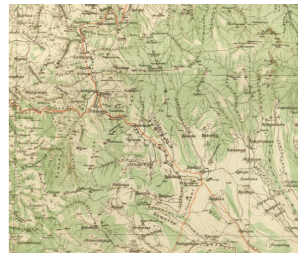
| Топографска карта Јанкове Клисуре

на Ђунису била принуђена на повлачење. Турско наступање у долини Велике Мораве, као и заузеће Књажевца и Зајечара, није се могло зауставити, па је уследила енергична дипломатска акција Русије. На поруку српске владе да спас лежи у брзом примирју, 30. октобра из Петрограда је стигао одговор да је Порти уручен руски ултиматум за примирје од шест недеља и прекид војних операција против Србије и Црне Горе у року од 48 часова. Турска влада дала је позитиван одговор већ сутрадан, 31. октобра. Примирје је ступило на снагу 1. новембра 1876. године. Велике силе су одредиле војну комисију која је од 12. новембра до 13. децембра одредила демаркациону линију и неутралну зону између српских и турских трупа. Примирје је истекло 20. децембра 1876. али је поново продужено.