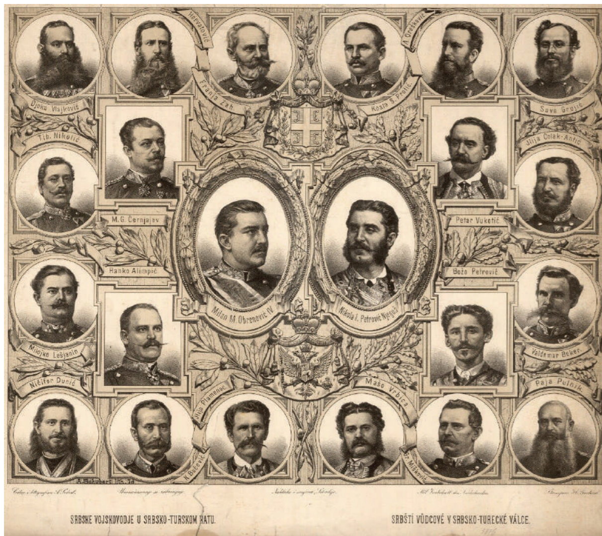
| Српске војсковође у српско-турском рату (Srbšti vůdcové v Srbsko-turecké válce). Aymon Schubert, A., Náklada i svojina Srbadije. Mit Vorbehalt des Nachdruckes H. Gerhart, 1876.

често претварало у панично бекство. Оскудевало се и у официрима. Руски официри, добровољци, нису разумели добро језик, нису познавали терен, нису имали искуства у руковођењу народном војском, а чинили су и тактичке грешке. Војници нису имали поверење у стране официре, а Врховна команда није имала довољно својих да их замени. Необучени војници нису хтели ићи напред док не би видели официре испред себе, а чим би официр погинуо, војници су губили присебност духа и повлачили се.